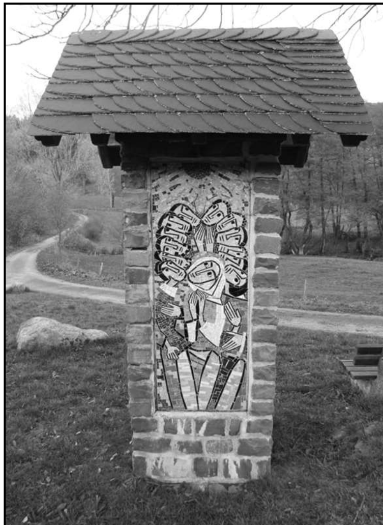
Marienpost in Bruchhausen - geschaffen von den Varenseiler Schwestern